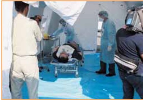
陰圧テント内での重症患者の診療および処置