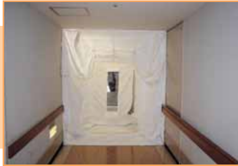
病棟の感染隔離ユニット、隔離エリアへ患者を移送