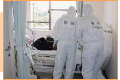
感染病棟での患者処置