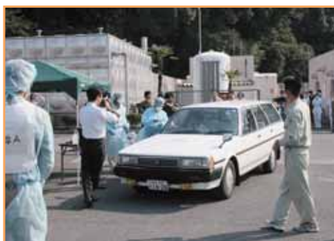
ドライブスルー診療の受付開始

市内において既に新型インフルエンザ患者が発生し、学校や事業所の閉鎖を行うなど感染拡大防止に努めている状況で、明石市立市民病院はその受け入れ体制の強化が求められ、市対策本部、兵庫県明石市健康福祉事務所との連携の下、市内某所において陰圧式テントによるドライブスルー型発熱外来を設置し、外来診察を開始した。発熱外来の受診者のうち、呼吸困難のため入院が必要な重症患者が発生し、感染症指定医療機関が既に満床であるため、明石市立市民病院に入院受け入れの要請が入り、発熱外来に受診、感染病棟に入院した。