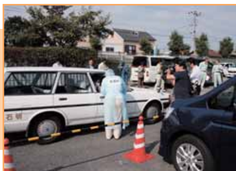
体温を測定し、問診を実施