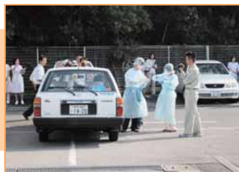
医師の診察を行い、簡易検査を実施