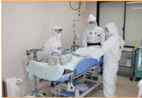
発熱外来内での診療および処置