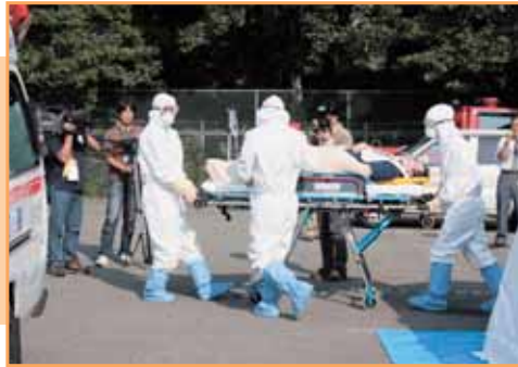
重症患者発生にて救急要請