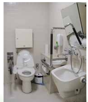
当院のオストメイト対応多目的トイレ