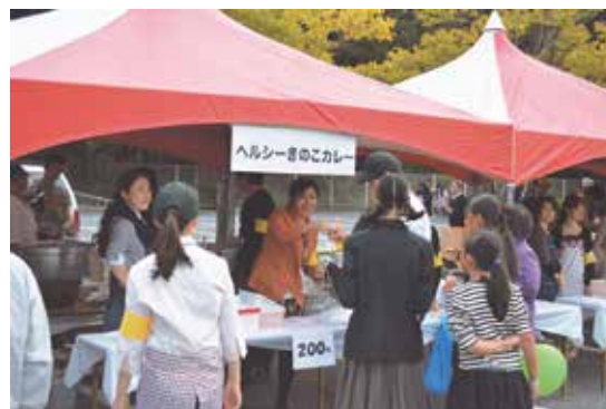
どの飲食コーナーも好評でした