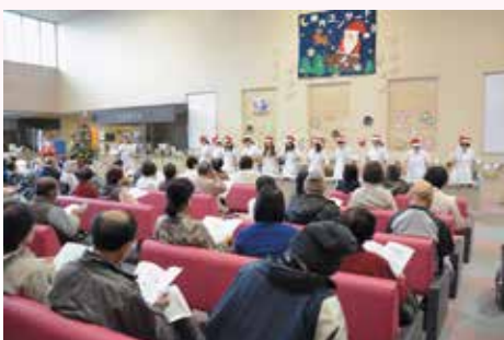
職員によるハンドベルの演奏を披露しました