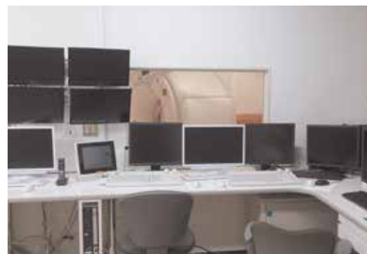
CTで撮影している様子をモニタリングしています