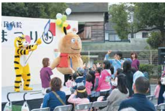
「明石・健康〇×クイズ」も行いました

1,000人以上の方に足を運んでいただき「来年も楽しみにしています」など嬉しい声を頂きました。地域との絆を深めることができた心に残る一日となりました。病院まつりにご来場下さいました地域の皆さまに、心より感謝しお礼申し上げます。本当にありがとうございました。