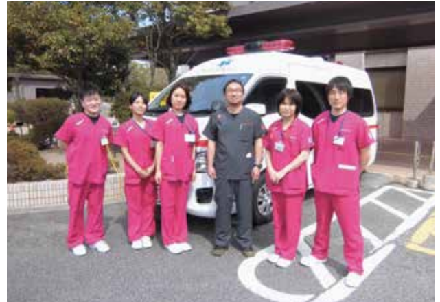
救急総合診療科スタッフ（右から3人目が小平部長）