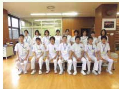
リハビリテーション課スタッフ

また、より早期からのリハビリテーションや、継続したリハビリテーションが特に必要と思われる 入院患者さんを対象に 、土曜日と日曜日のリハビリテーションの実施を、平成25年11月から始めました。今後とも、患者さんのさらなる回復に貢献していきたいと思っております。