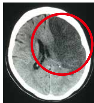
広範囲脳梗塞の症例