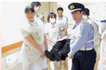
怪我人を搬送する訓練

訓練終了後には、消火設備・誘導経路の再確認をする姿や訓練の反省点・改善提案などの意見交換も行いました。今回の消防訓練が充実した訓練であったことを実感しました。