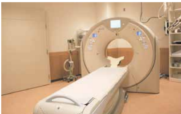
新たに導入した80列マルチスライスCT装置

本装置は高齢の患者さんから小さいお子さん、救急患者さん、さらに心臓検査、血管系の検査など幅広く対応できる装置です。2台のマルチスライスCTを有効に活用し、地域医療に貢献できればと考えています。