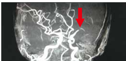
脳血管の閉塞例（矢印部分で閉塞）

脳神経外科では脳腫瘍、脳血管障害、頭部外傷などに対して診断、治療を行う診療科です。脳血管障害は脳動脈瘤からの出血をきたすくも膜下出血、高血圧を基礎に発症する脳内出血、脳血管が詰まることによる脳梗塞に大別され、近年脳梗塞の頻度が増加しています。脳血管障害は早期の診断と治療の開始とともに、リハビリテーションを行っていくことが重要です。